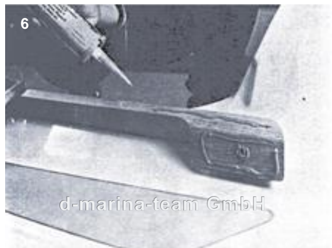
Cockpit-Süllverkleidung mit Sikaflex sorgfältig einstreichen. Hier sollte reichlich Sikaflex aufgetragen werden. Um eventuelle kleine Unebenheiten auszugleichen. Überschüssiges Sikaflex nach dem Anschrauben sofort entfernen