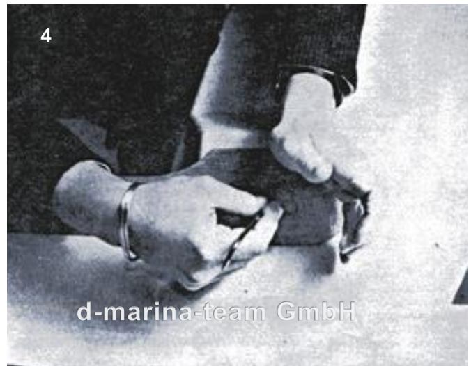
Bohrung für angepasste Leiste markieren