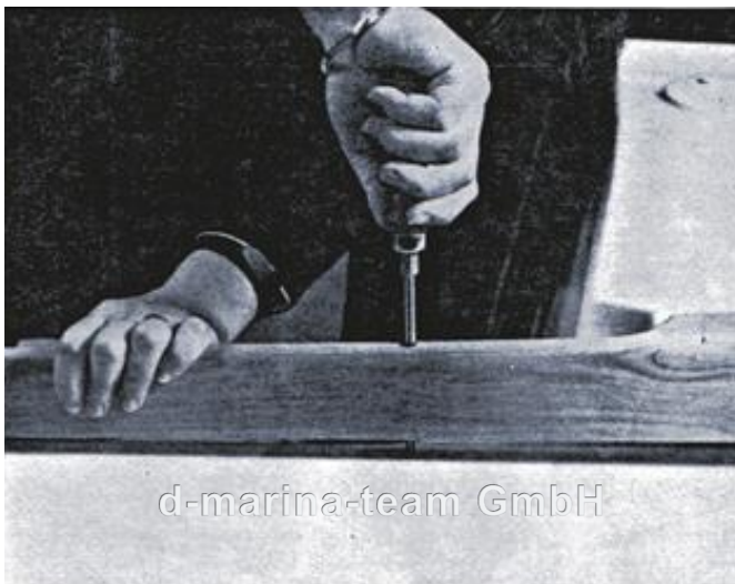
Die Cockpit-Süllleiste wird zuerst ohne Sikaflex verschraubt und jeweils eine Bohrung am Kopfteil Bb. und Stb. anzeichnen zu können