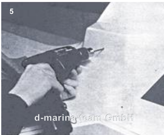
Loch 3,5mm bohren