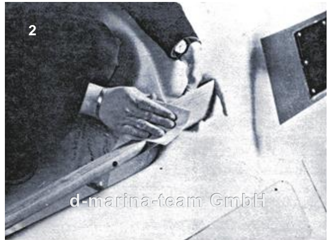
Cockpit-Süllleiste in den Rundungen sorgfältig beischiefen