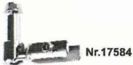
für Lattenbeschlag alt, weiß