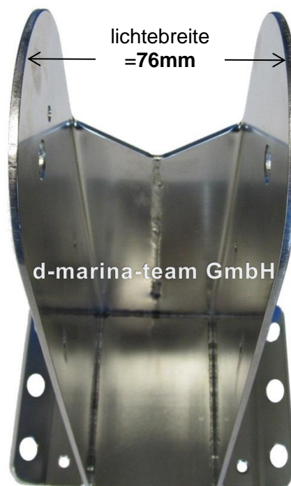
Bohrbild 90 x 110mm