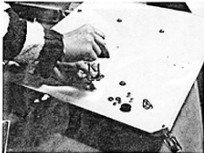
Doppelblock zusammenstecken und darauf achten das Mittel- und Außenbleche richtig montiert werden