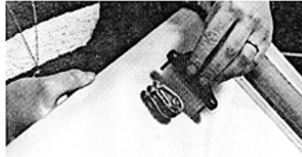
Kammklemme (Clamcleat) eindichten und festschrauben