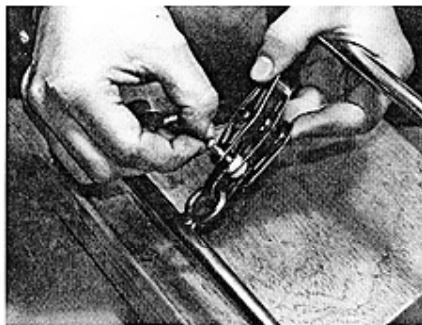
Block mit Hundsfot am Niro-Auge befestigen