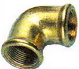
ROHRWINKEL Messing, mit Innengewinde.