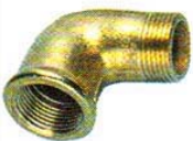
ROHRWINKEL Messing. Je ein Innen- und Außengewinde.