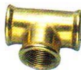
T-STÜCK Messing, Innengewinde.